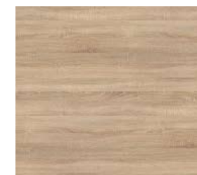
Bordalino tölgy bútortalap Bútor Baja