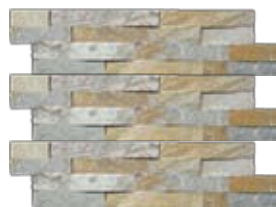
Kvarcit falburkolat bauMax

Karakterelemek: Ha túl homogénnek érzed modern lakásodat, megmozgathatod a síkokat 3D felületű burkolatokkal. Hasonló hatások eléréséhez az Otthon a következő alapanyagokat ajánlja: