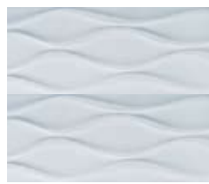
London Nacar falicsempé Porcelanosa mintaterem