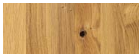
Tölgyfa padló, Parador

Karakterelemek: a natúr téglá, a természetes fa és a nyersbeton-felületek alapozzák meg a hangulatot a loft lakásban, amelyekre mi is kerestünk elérhető variációkat. Az Otthon javaslatai: